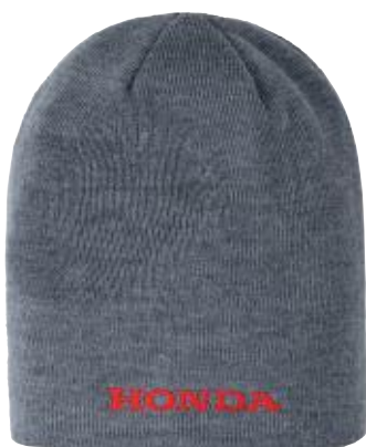
CORPO REVERSIBLE 243-0506042-03