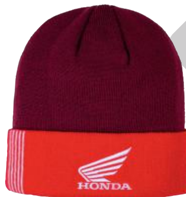
RED RACING 243-0506042-01