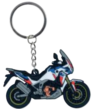
7cm AFRICA TWIN RUBER 233-0601015