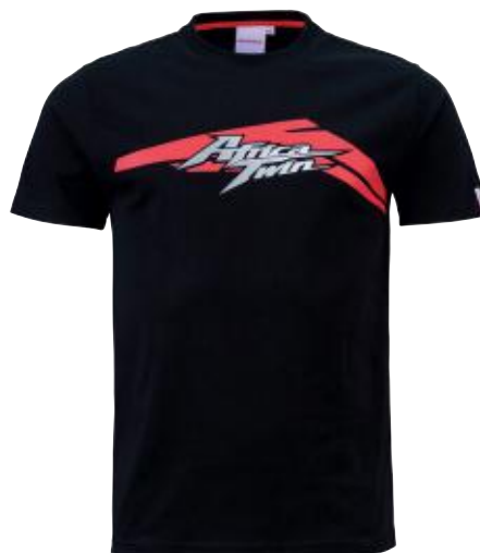
AFRICA TWIN BLACK 233-8820040-09