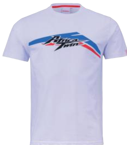
AFRICA TWIN WHITE 233-8820040-00