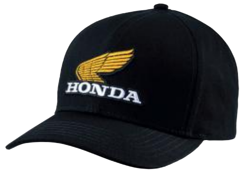
VINTAGE BLACK 243-7020060-11