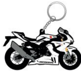
7cm CBR RUBER 233-0601014