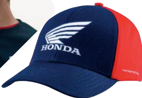
RACING NAVY 243-7020060-02