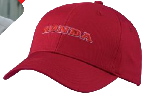
TOKYO RED 233-7020060-01