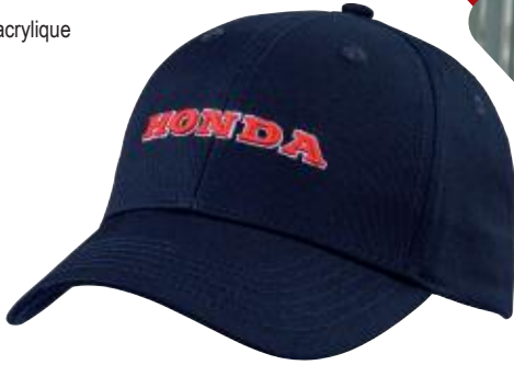
TOKYO DENIM 233-7020060-02