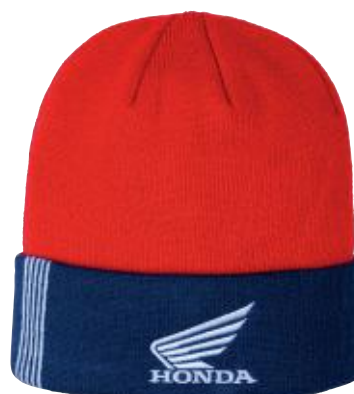
NAVY RED RACING 243-0506042-20