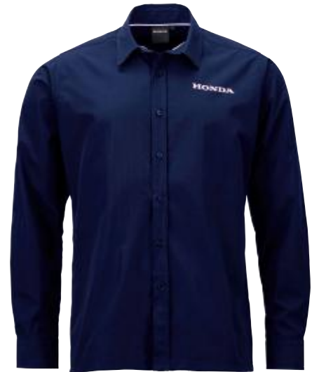
S > XL