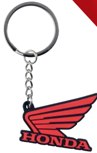
4cm WING RUBBER 233-0601013