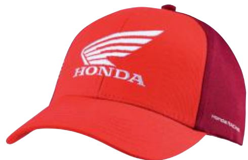
RACING RED 243-7020060-01