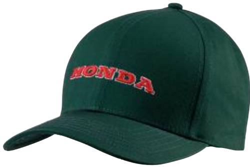
TOKYO GREEN 243-7020060-05