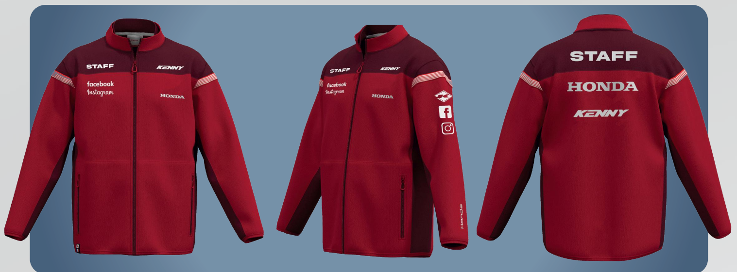
Logo et/ou texte FACE