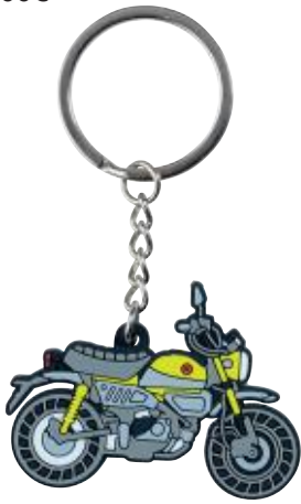
5cm MONKEY RUBER 233-0601016